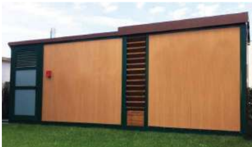
Esempio modulo singolo per caldaie da 30–100kW