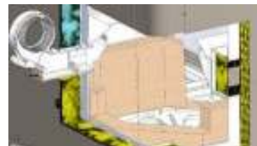
Controllo ottico della camera di combustione (fotocellula)