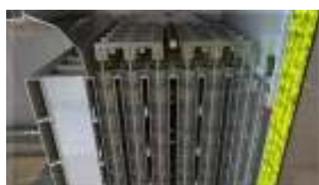
Pulizia scambiatore di calore ad alta tecnologia