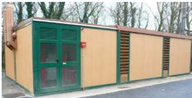
Esempio con magazzino doppio