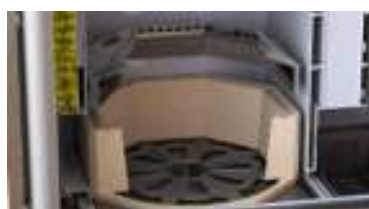
Camera di combustione con griglia ruotante autopulente patentata