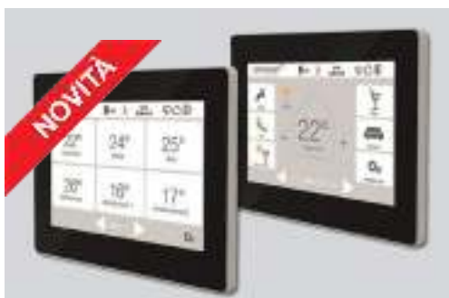
Display touch multi-colore proiettivo-capacitivo da 4,3 "

La stessa comodità offre la centralina ambiente WLAN che permette con il suo grande display multi-colore Touch a gestire l'impianto da remoto.