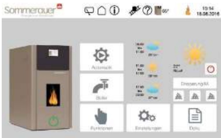
Display touch multi-colore proiettivo-capacitivo da 4,3 "