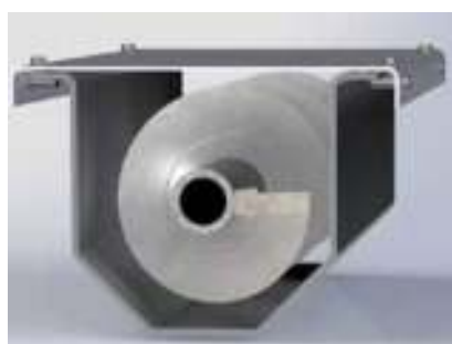
Coclea e canale coclea con copertura rimovibile — sistema industriale