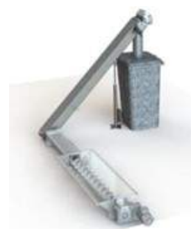
Sistema di estrazione ceneri con serbatoio grande