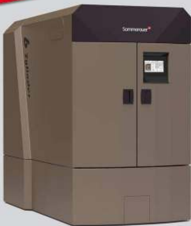
Caldaia a cippato ECO PREMIUM S 199Kw—250 kW con tecnologia a 6 cilindri patentata