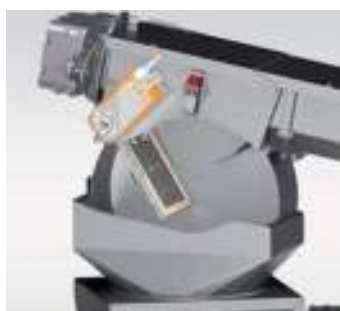
Testa di trasferimento cippato con sportello antiritorno di fiamma certificato IBS