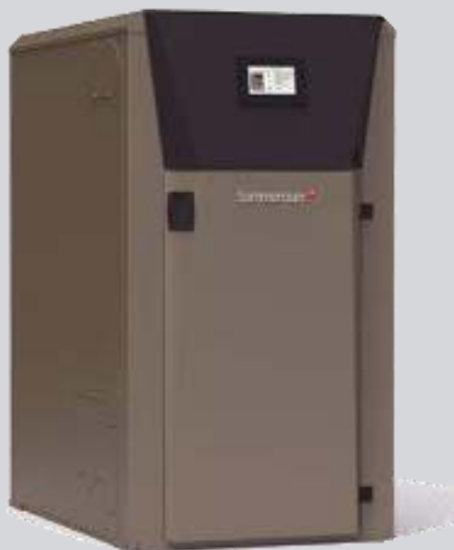
Caldaia a cippato ECO PREMIUM S 30Kw—100 kW con tecnologia a 4 cilindri patentata